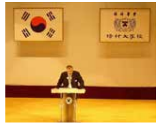
嘉利利国际管理学院校长在亚洲校长论坛上进行演讲