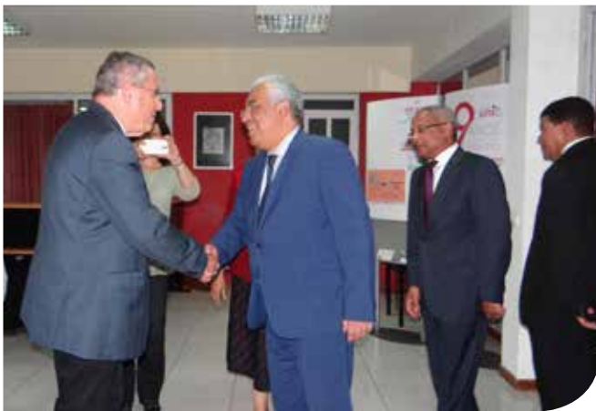
Shevel博士/院长与葡萄牙总理会晤