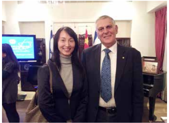
对华合作部主任谢亚妮女士和2011年诺贝尔化学奖得主丹尼尔·舍特曼教授亲切合影