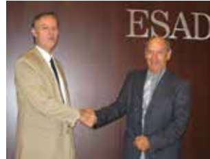
嘉利利国际管理学院教务主任 Tirosh博士和ESADE校长 Losada教授在巴塞罗那会晤