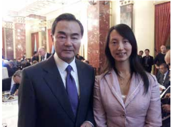
对华合作部主任谢亚妮女士和王毅外长亲切合影

嘉利利国际管理学院还非常热衷于和中国的高校们进行合作，从2012年至今已经特别为中国的大学生们组织了多期《以色列科技创新》和《通过艺术、宗教和历史理解巴以文化和冲突》的暑期项目，所有的师生们都对项目非常满意。我们的项目还受到了中国驻以色列大使馆和外国专家局的高度重视和赞扬，大使曾经亲自出席毕业典礼，《科技日报》也对我们培训活动做了精彩的报道。