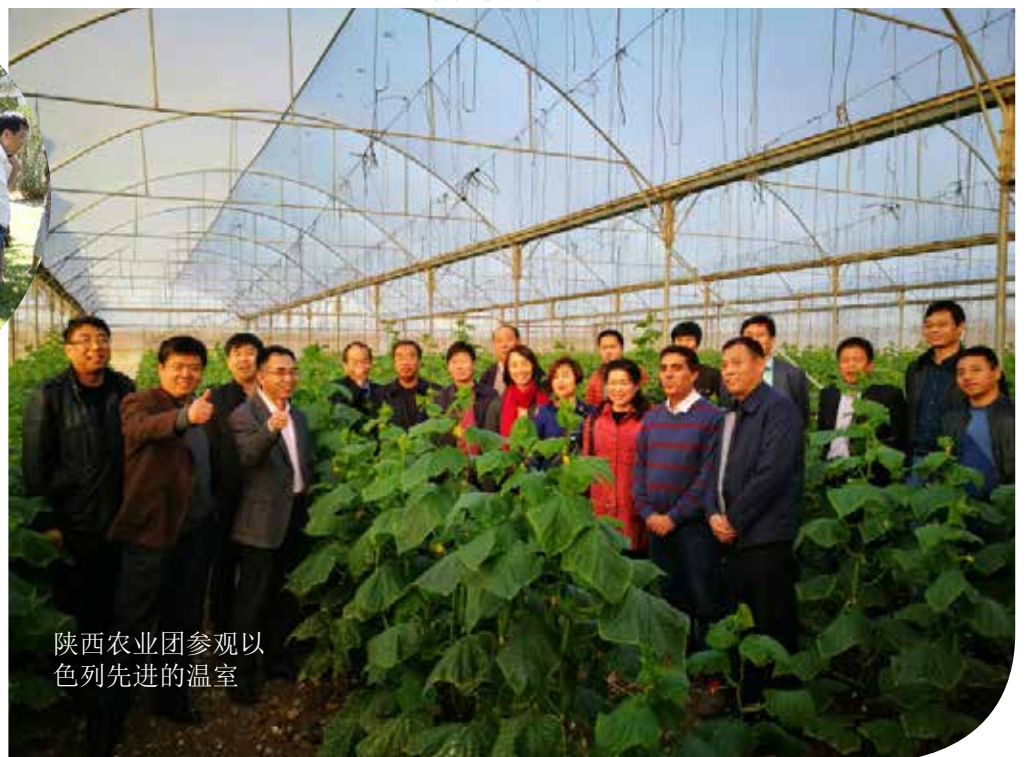
陕西农业团参观以色列先进的温室